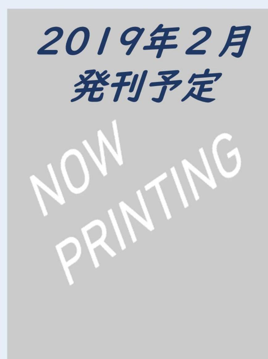
GPのための矯正治療 (仮題) 中島稔博先生